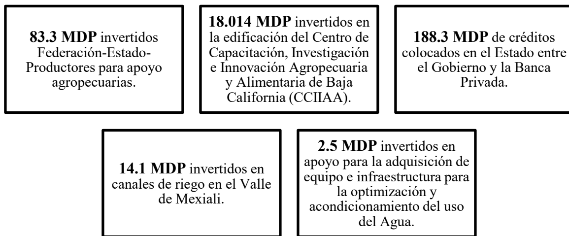
Figura 2. Principales acciones en el sector primario.